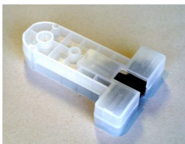
Aufzugsbürste für die Schmierung von Führungsschienen mit Breite 5-16mm und Tiefe bis 25mm.