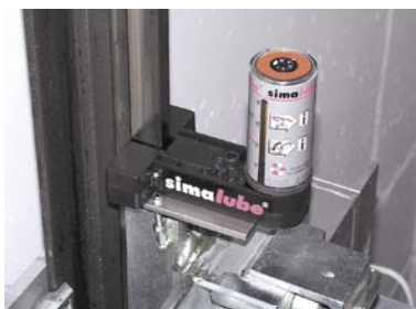
Komplett montiertes simalube-Aufzugsschienenschmiersystem mit Aufzugsbürste und Spender.